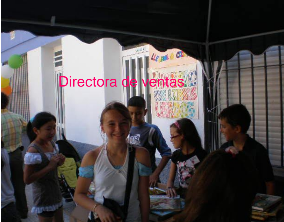
Directora de ventas