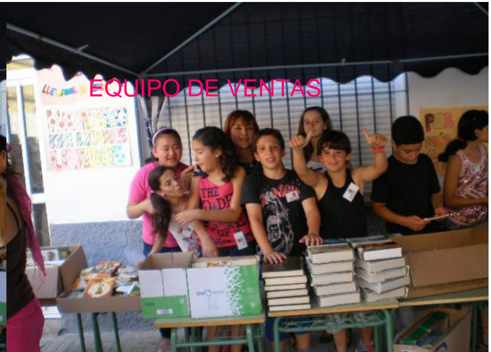
EQUIPO DE VENTAS